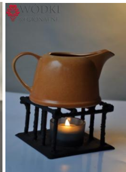
Fot. Zestaw dzbanuszek do podgrzewania alkoholu plus cztery czarki w kolorze jasnym.