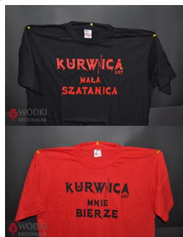
Fot. T-shirty Kurwica.