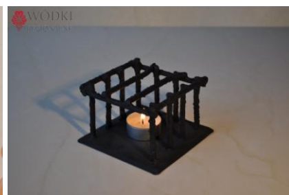
Fot. Opakowanie klatka na podgrzewacz.