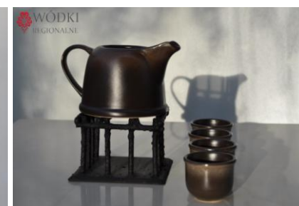
Fot. Zestaw dzbanuszek do podgrzewania alkoholu plus cztery czarki w kolorze ciemnym.