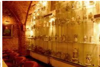
Fot. Wnętrza stylowego lokalu w Browarze Żywieckim, gdzie odbywać się będzie Wasze wesele.